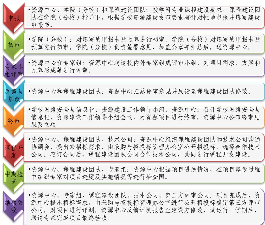
图一 项目管理流程图