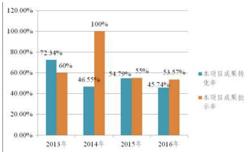
图 1-2 《专家反映》2013 年-2016 年成果转化率与批示率分析

从图 1-2 数据显示看，本项目成果转化率为 2013 年最高，之后趋向于递减；成果批示率是 2014 年最高，之后趋向于递减。