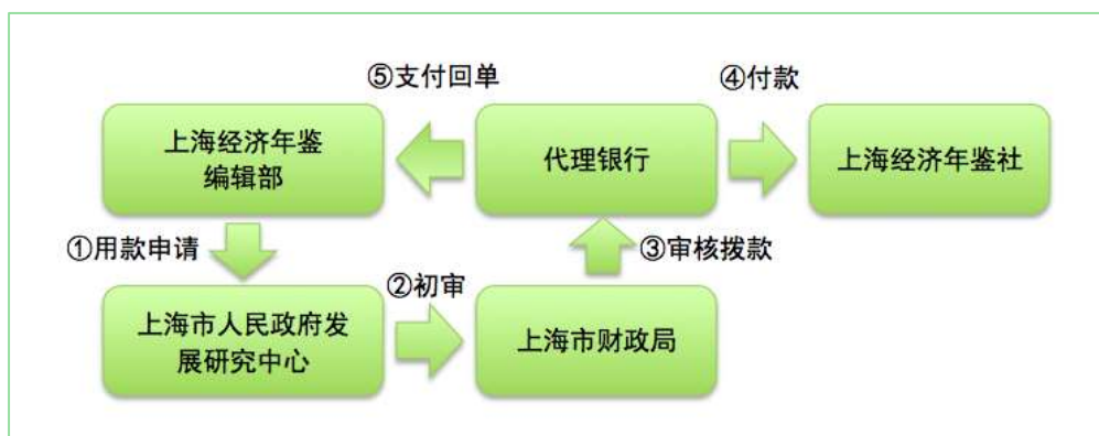
图 2 2016 年上海经济年鉴业务费资金拨付流程