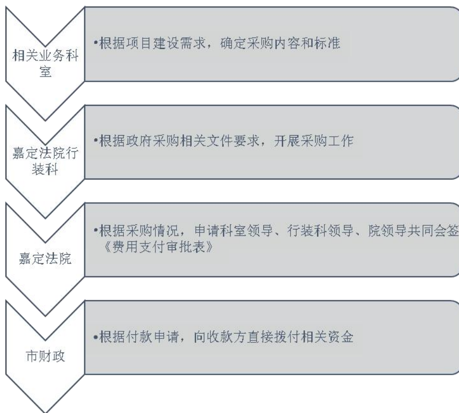
图 1-2 非政府采购类资金拨付流程图