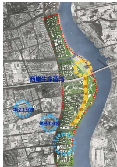
图 3.8 南部战略拓展区 (徐汇滨江)

南部战略拓展区： 以“品质引领、功能复合”为特色，打造国际大都市的科创重镇和生态新城，成为引领南部地区发展的形象标杆区。贯彻落实全市民心工程建设要求，加快推动龙腾大道、开放空间向南延伸至闵行，结合体育公园建设、划船俱乐部迁建、桥下空间，活化利用上粮六库推进南部地区规划实施，促进南北均衡发展。