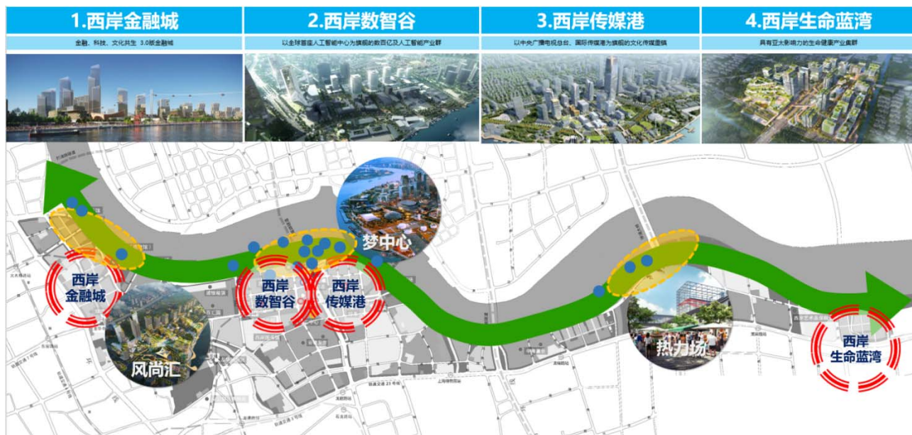
图 2.2 徐汇滨江地区“十四五”空间布局

对接上海 2035 城市总体规划、徐汇区单元规划，按照优势凸显、产业集聚、功能融合、高效配置资源、区域协同发展的要求，着力构建“一极崛起，四核驱动，三区示范”的空间发展布局。