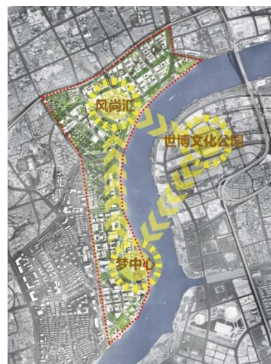
图 3.6 北部中央活动区 (徐汇滨江)

北部中央活动区： 以“文商融合、多元活力”为特色，强化科技创新、金融服务、总部经济、商务办公、创新创业等核心功能，努力成为上海主要功能的核心承载区。徐汇滨江区域聚力打造国际名片，集中体现黄浦江两岸建设成果，构筑拥江发展的美好生活。