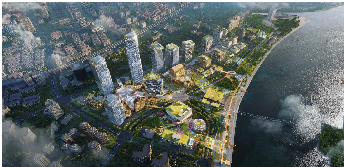
图 3.4 科技金融产业发展集群（西岸金融城）

汇滨江-徐家汇-漕河泾-衡复为主要节点的金融产业布局，推动科技金融集聚发展。加强科技金融创新全球影响力培育，加快集聚高能级金融机构，集聚发展大型企业财务中心、金融投资中心、资产管理中心、融资租赁、再保险等新兴金融业态，积极举办上海国际金融中心发展论坛等专业活动。加速金融科技应用场景构建，借助西岸人工智能等新技术发展优势，推动在金融领域的广泛应用，助推金融机构运用信息技术升级基础设施、优化业务流程，推动金融科技核心技术的研发和应用。