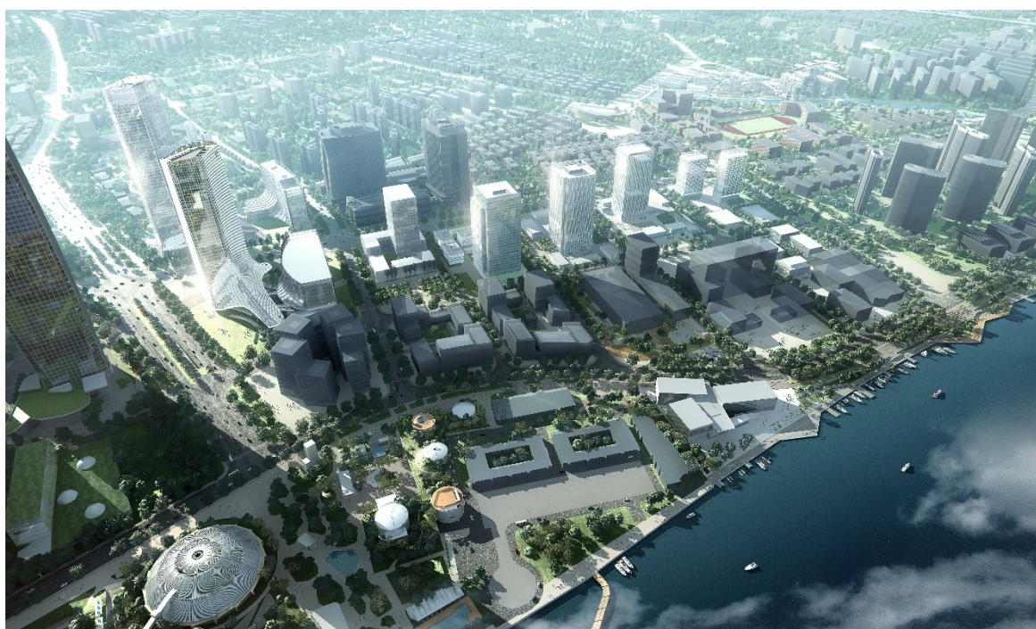
图 3.2 人工智能产业发展集群（西岸数智谷）

交流合作，打造全场景合作交流平台。结合人工智能创新与应用，充分发挥“双 A”战略新优势，推进城市数字化转型，加速推进“AI+”多元应用场景落地，深化人工智能与艺术传媒、科技金融、生命健康等产业融合发展，建设人工智能场景赋能集聚示范区。