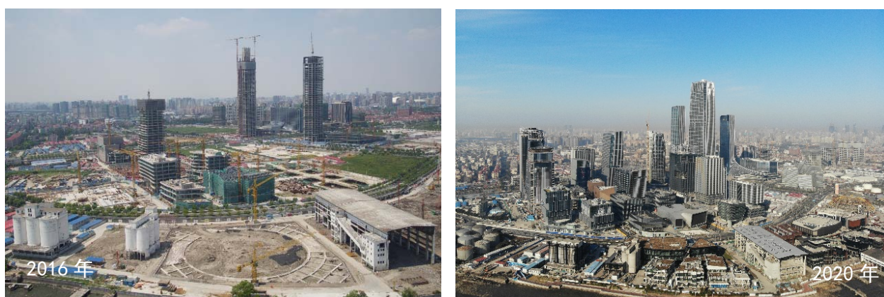
图 1.2 产业载体开发成效

平台纷纷落户徐汇滨江，人工智能产业集群建设受国务院表彰激励，国内领先、国际知名的人工智能产业集聚区和应用示范区建设规模显现。油罐艺术公园、西岸美术馆等重大文化项目相继建成开放，与法国蓬皮杜艺术中心开展 5 年展陈合作，美术馆大道树立起艺术地标；西岸艺博会成为全球艺博会版图上不可或缺的一站，上海国际艺术品交易月落户西岸，上海国际艺术品交易中心、上海国际文物交易中心入驻西岸，“艺术西岸”文化品牌效应彰显。