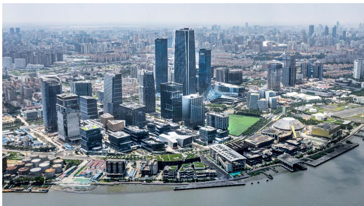
图 3.3 艺术传媒产业发展集群（西岸传媒港）

大剧院、上海大歌剧院市级高水平资源，引进国际高水平演出团队，建设高水平剧场演艺群落，深化实施“首展首秀首演”计划，助力上海亚洲演艺之都建设。平台优化升级，依托上海艺术品交易月，继续做大西岸艺术与设计博览会，做实上海国际艺术品交易中心，做强国际艺术品产业地标，发布行业数据、行业标准等行业信息，打造艺术品交易的全球艺场，助力上海建成千亿级规模艺术品交易市场，持续向全球产业领域发声。活动持续引爆，依托艺术季做强城区营销，引领区域文商旅体融合发展。深度串联美术馆大道及未来剧场群落，构筑“全球首展首秀首发新平台”，促进文商旅深度融合。