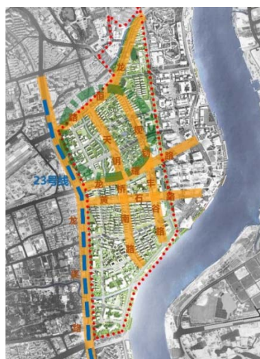
图 3.7 中部融合更新区 (徐汇滨江)

中部融合更新区： 以“水绿成网，双翼协同”为特色，打造产城融合发展的引领示范区，成为徐汇城市更新的特色样板区。徐汇滨江区域做好规划提升，强化基础设施开发，升级公共服务设施，打造上海城市更新的特色样板区。