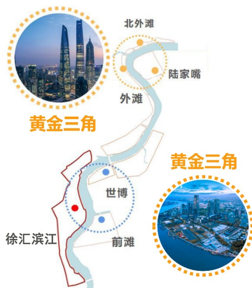
图 2.1 黄浦江两岸“十四五”两个“黄金三角”核心功能区

面向 2035 远景目标，到 2025 年，滨江高质量发展实现新突破、人民城市建设取得新成效、核心竞争力迈上新台阶，全力打造成为“ 科创策源新引擎、产业转型新高地、全球资源汇聚地、治理实践先导区、人居生态示范区 ”，按照“一江一河”发展战略要求，与“ 外滩-陆家嘴-北外滩 ”联动呼应，构建“ 世博-前滩-徐汇滨江 ”发展黄金三角，成为世界闻名的卓越水岸、上海新时代的地标、卓越徐汇的标志，完成国际大都市卓越水岸的核心构建。