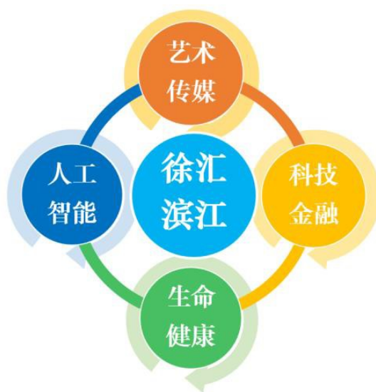
图 3.1 徐汇滨江地区产业结构示意图