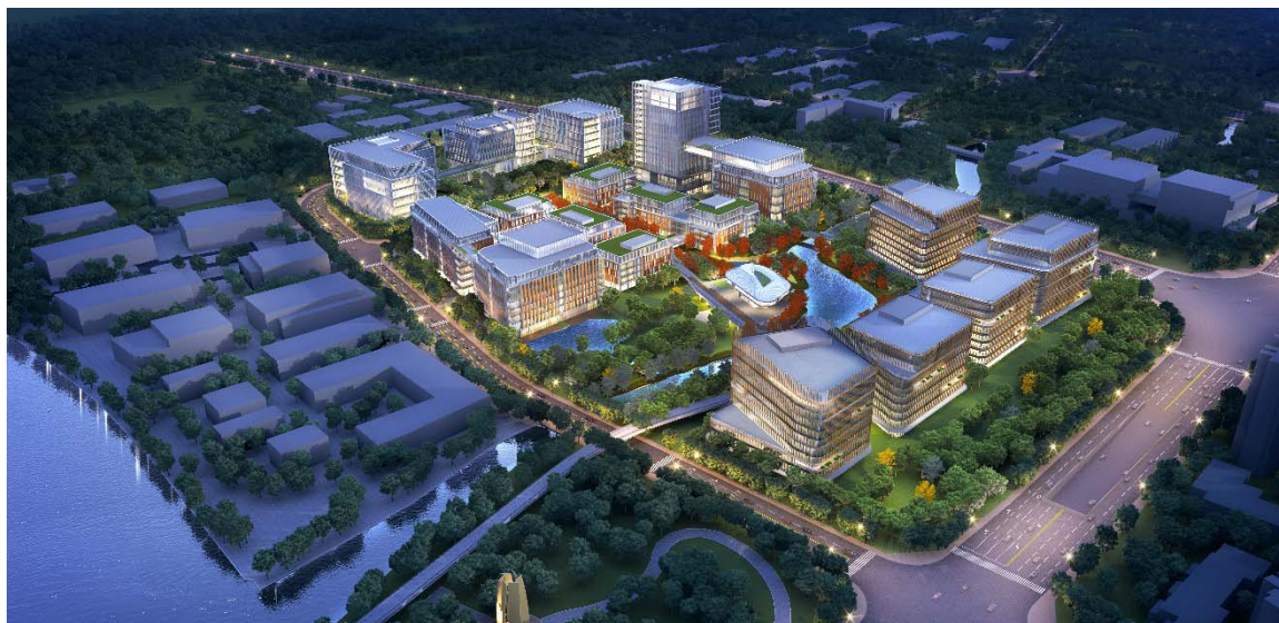
图 3.5 生命健康产业发展集群（西岸生命蓝湾）

部地区发展潜力。支持区域医院、科研机构和企业参与实施生命健康领域全球大科学计划，建设“上海国际医学科创中心”等协同创新平台。