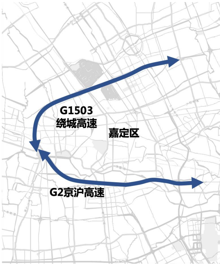
图 2 嘉定区域内部分高快速路自动驾驶开放测试道路示意图