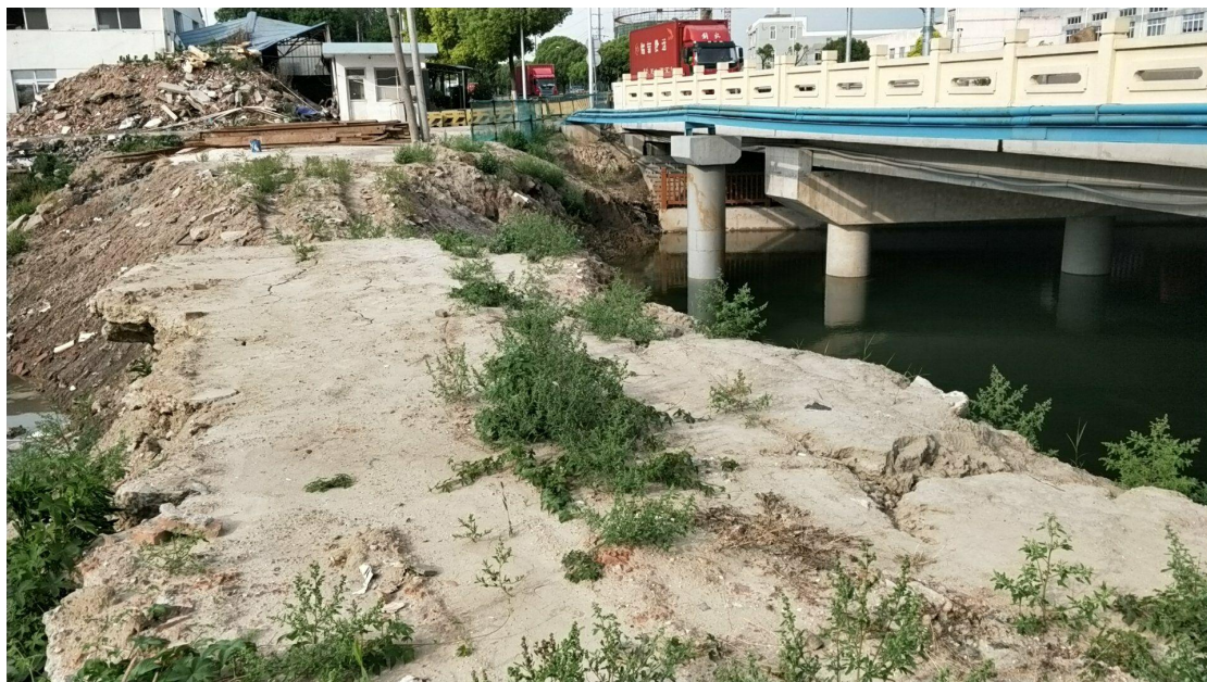
附件 7 施工地点当前情况图