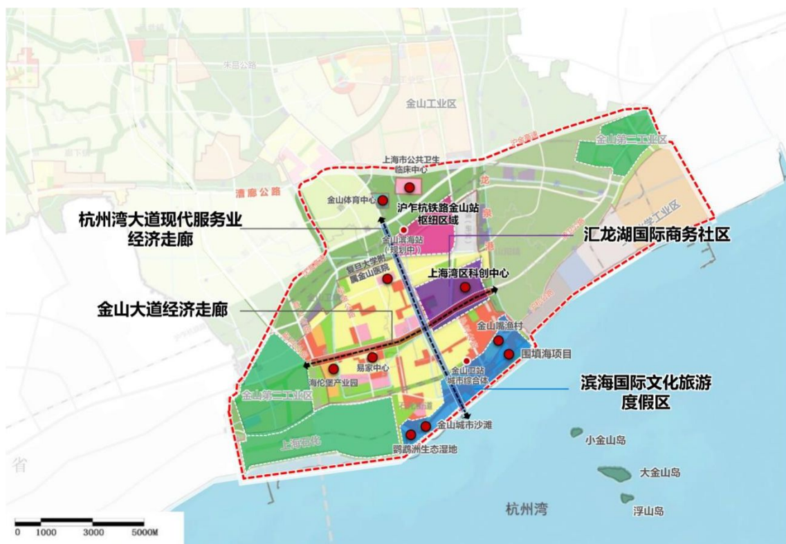
图 2 金山滨海地区重点发展区域布局图