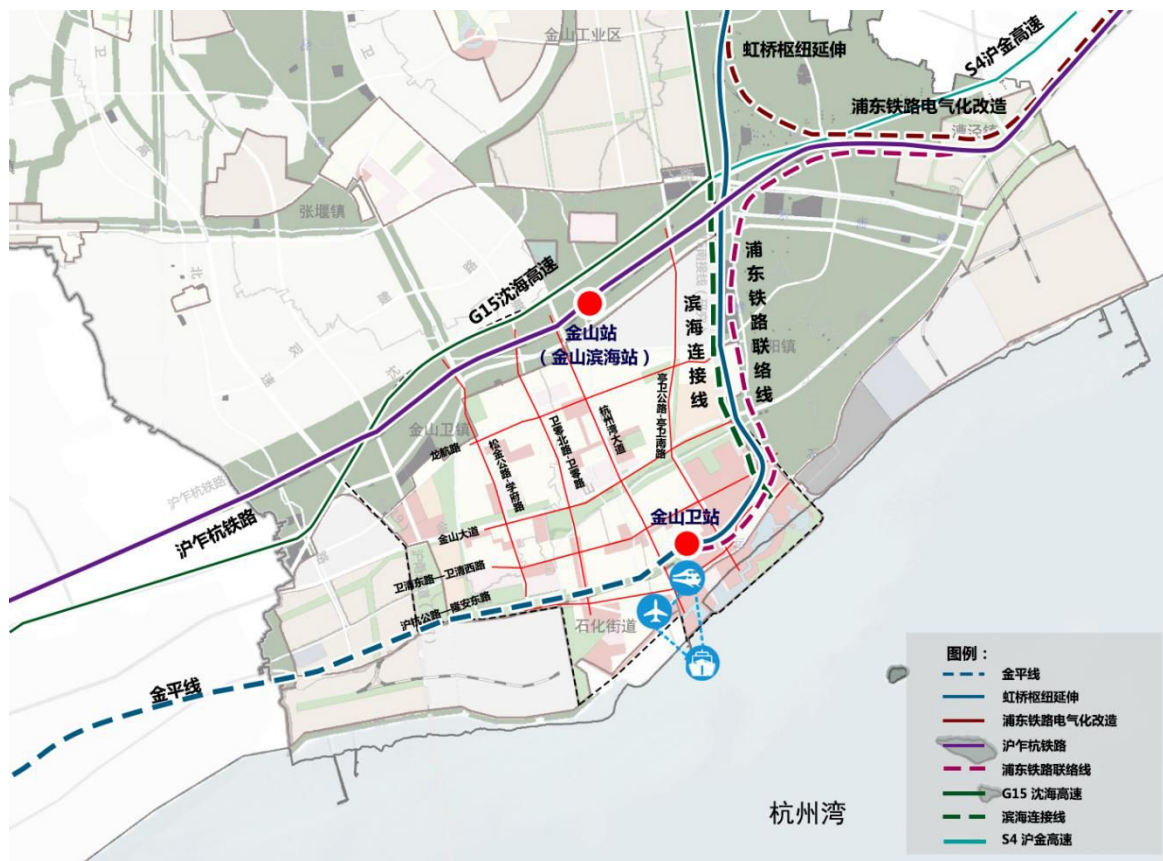
图3 金山滨海地区“十四五”交通系统规划图