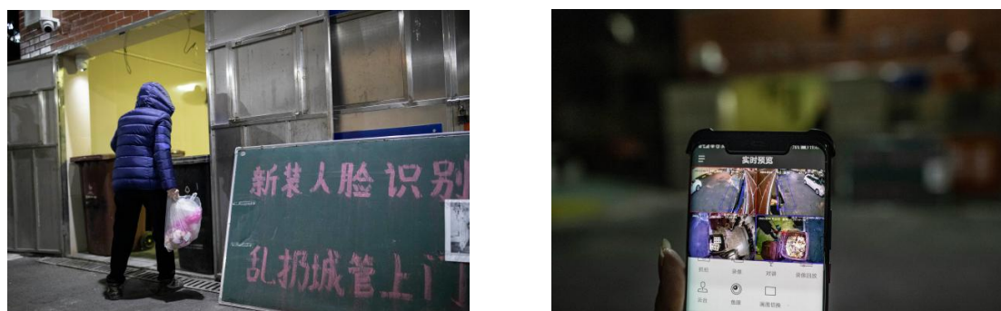
图 6-2 五角场街道智能监控系统宣传标语（左）与 APP 端工作界面（右）

2020 年 12 月起，五角场街道的政立路 580 弄小区、国顺路 81 弄小区、政立路 830 弄小区以及三湘世纪花城三期学府街 88 弄小区居委进行了垃圾分类智能管理试点，并在区统一安排下开展了垃圾分类指导员撤离居住区试点工作。试点情况显示，该智能监控系统大幅降低了垃圾投放时间段外的小包垃圾乱堆放现象，有效提升了垃圾厢房及周边的环境卫生状况，同时也实现了管理人员缩减、管理效能提升。