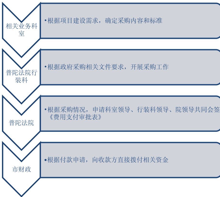
图 1-2 非政府采购类资金拨付流程图