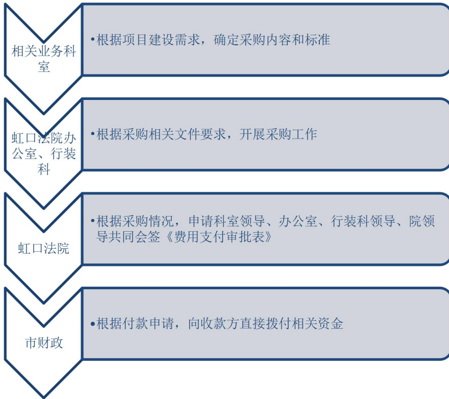
图 1-2 授权支付资金拨付流程图