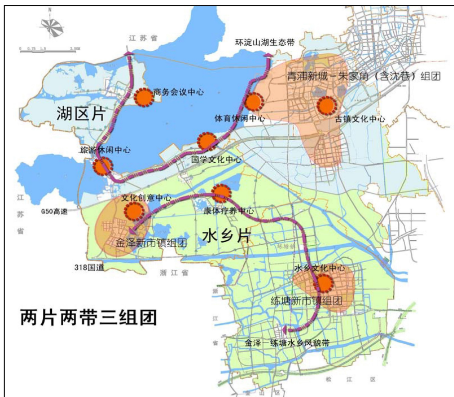
图 2 淀山湖地区发展规划结构图

以 G50 高速公路为界，北部为湖区片，发挥滨湖景观优势，强调公共性和生态性，坚持严格的低碳要求，以景观生态休闲为主要功能，加强区域联动，主动对接周边地区，建设与上海国际大都市功能相适应的知名湖区核心区域。南部为水乡片，发挥水网密布的自然优势，构建和谐水生态环境，将独特的水乡文化融入到生态建设之中，打造长三角知名的水乡文化区。